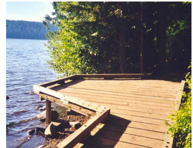
Ein barrierefreier Seenrundwanderweg in Oregon USA

Auch ist zu klären, wie die touristische Nutzung in schutzwürdigen Gebieten aussieht und wie im Rahmen der Schutzgesetze touristische Erschließungen eingebunden werden können.